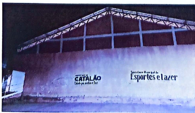
Núcleo 3 — Quadra do bairro Castelo Branco