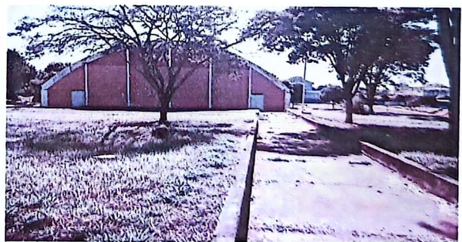
Núcleo 1-Ginásio de Esportes "Teófilo Silva" - São João