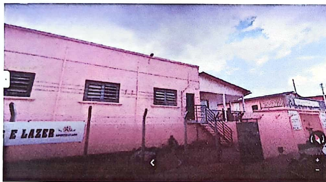
Núcleo 1 - Secretaria Mun. de Esportes e Lazer

O projeto teve duração de 6 meses e foi executado nos locais indicados e aprovados no plano de trabalho, com as condições de acessibilidade, conforme preceitua o Art. 16 do Decreto nº 6.180/2007: Núcleo 1 - Ginásio de Esportes da Secretaria Municipal de Esporte e Lazer, situada na rua Vereador G. Aires, 130 - Mãe de Deus, Núcleo 2 - Ginásio de Esportes "Teófilo Silva/São João" - Rua Inglaterra, 62-132 - Loteamento Vila Chaud e Núcleo 3 , Quadra do bairro Castelo Branco, na Rua 96, s/n - bairro Castelo Branco. O projeto "ASCITE Handebol de Catalão", foi desenvolvido nessas três regiões de Catalão/GO, conforme fotos em anexo cujos locais são públicos, mas não há intervenção do Poder Público com ofertas de aulas na modalidade do Handebol.